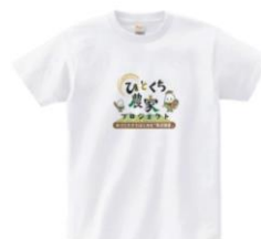
（オリジナルTシャツイメージ）