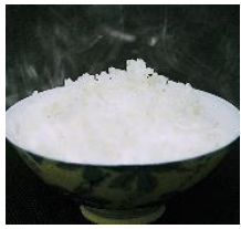
にじのきらめき 炊きあがりイメージ