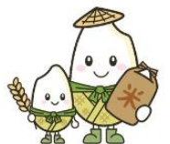
公式キャラクター マイちゃん親子