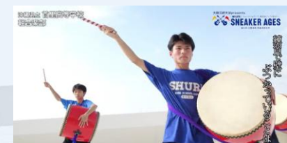
▲沖縄テレビ特番 (1時間)