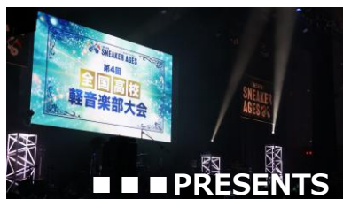
ライブ配信時のタイトル画面