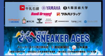
協賛企業様 スクリーンロゴ掲出