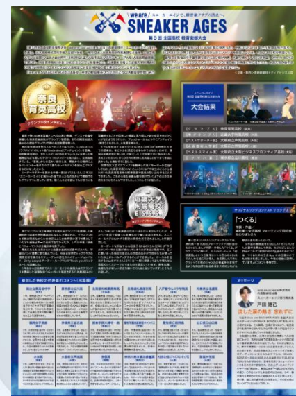
▲産経新聞 全国大会 事後特集