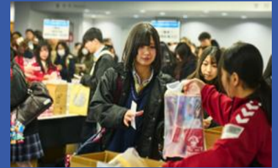
協賛企業様 告知物配布