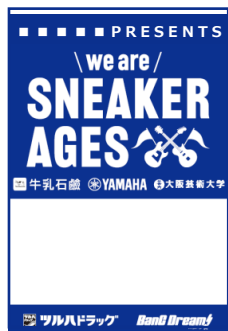
バックステージパス