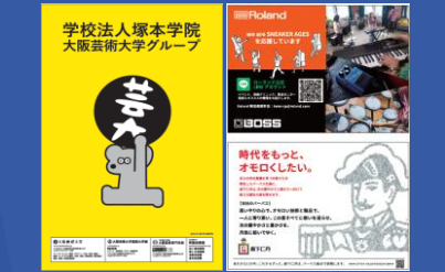
協賛企業様 プログラム広告