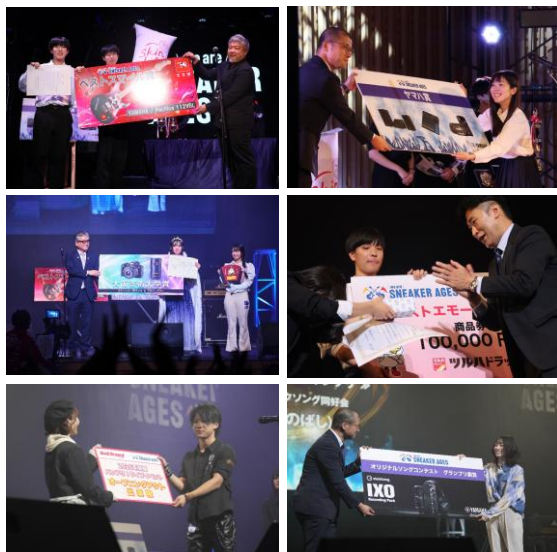
(副賞受け取りの様子)

全国大会・地区グランプリ大会の際に協賛社様の特別賞/副賞を制定・授与していただけます。