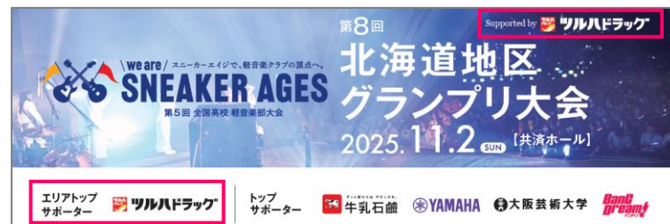
地区大会の掲出物に露出いたします

※ご協賛枠により露出内容が変わる場合がございます。P20.21の協賛メニュー一覧より適応範囲をご確認ください。