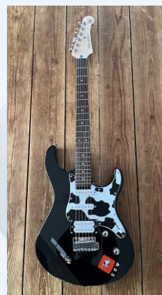
▶ベストスマイル賞 牛乳石鹸オリジナルギター