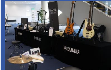
協賛企業様 展示ブース