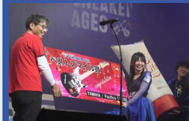
協賛企業様 特別賞贈呈