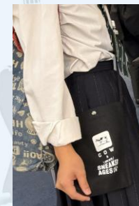
▲出場者に配布した オリジナルサコッシュ