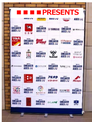
スポンサーバナー