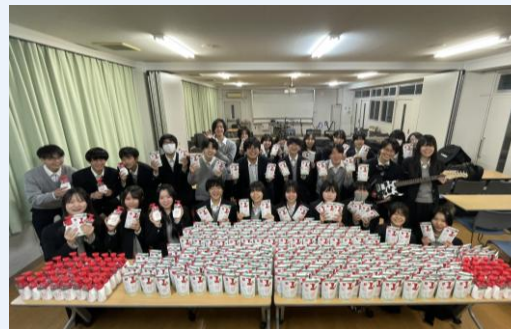
ベストスマイル賞 全員にスキンライフ1年分