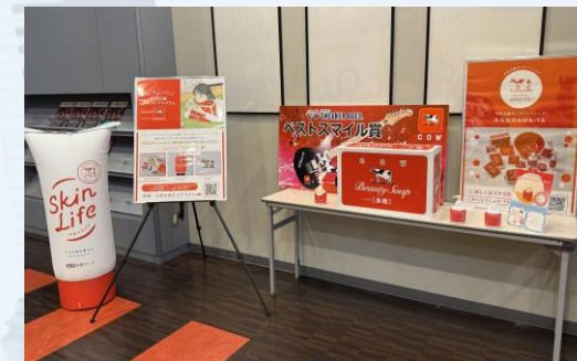
▲会場内の展示ブース