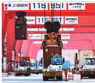
6月17日、中国・上海郊外の港で、コンテナをクレーンで荷揚げするため整列するトラック

6月関税引き下げで改善 【北京14日電】中国関税総局が14日発表した6月の貿易統計(ドル建て)によると、米国の向け輸出は前年同月比16%減の3億1100万ドル(約3兆6000億円)だった。米中関係が5月中旬に互いに追加関税を相互に引き下げたことを受け、5月の34.5%減からは持ち直したものの、依然として2桁のマイナスが続いている。 米国の輸出は15.5%減。世界全体の輸出は1.1%増の2104億4千万ドルだった。5月の輸出は1477億7千万ドルで、1477億7千万ドルとほぼ同じだった。貿易黒字は1477億7千万ドルとほぼ同じだった。 6月の世界全体の輸出は1477億7千万ドルで、5月の輸出は1477億7千万ドルとほぼ同じだった。貿易黒字は1477億7千万ドルとほぼ同じだった。