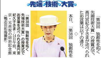
高宮宮久子さま お言葉全文

日証投協の「日野隆司」検討 【東京14日電】日本証券業協会の日野隆司会長が、今後の活動方針について検討している。日野氏は、今後の活動方針について検討している。日野氏は、今後の活動方針について検討している。日野氏は、今後の活動方針について検討している。